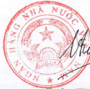
Đoàn Thái Sơn